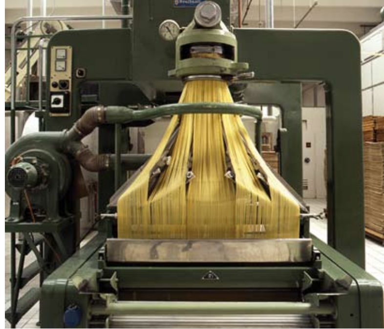
Teigwarenherstellung bei der Pastificio Simona SA