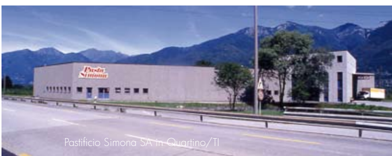
Pastificio Simona SA in Quartino/TI

Gründungsjahr: 1974 (durch eine freie Basler Arbeitsgruppe «Dreigliederung des sozialen Organismus») Eigentumsform: Aktiengesellschaft Betriebsstruktur: GV, VR, Geschäftsführer, Kader Umsatz 2006: CHF 26,1 Mio (Okt.2005 bis Sept.2006) Anzahl Artikel: 4600, davon 1600 im Non Food-Bereich Anteil Demeter: 21 % im Foodbereich, resp. 650 Artikel Marke Vanadis: 100% Demeter Anteil Bio-Produkte: 100% im Food-Bereich Demeter Lizenz seit: 1975 Vertriebskanäle: Bio-Fachgeschäfte, Heime, Spitäler, Gastronomie