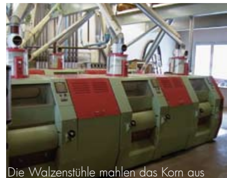
Die Walzenstühle mahlen das Korn aus