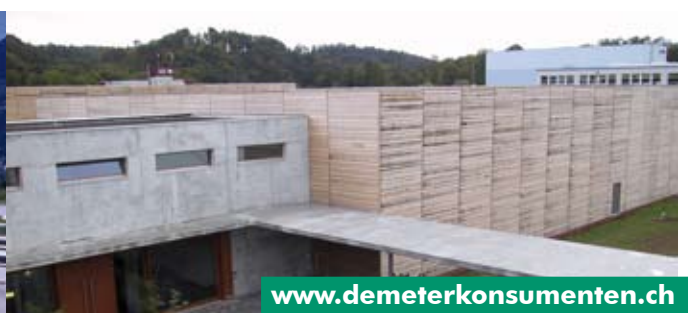
Biopartner in Seon/AG mit Vanadis AG